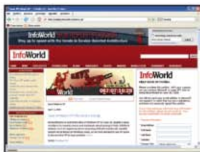
(fig.1) Pagina in cui condividere il file con un utente.

Nonostante il successo planetario di Windows Vista, molti utenti non vogliono abbandonare Windows Xp, al punto di lanciare una petizione su internet chiamata Save XP ( http://