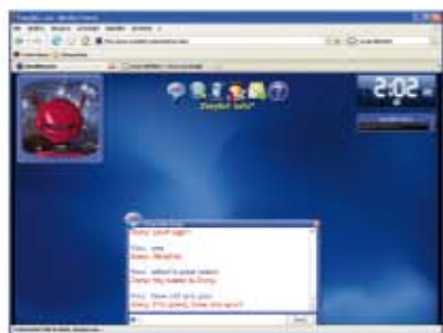
(fig.4) Pagina in cui condividere il file con un utente.

zionarsi nella riga bianca e digitare la parola o l'argomento che ci interessano. Quindi premiamo il pulsante blu con la lente di ingrandimento. (fig. 3)