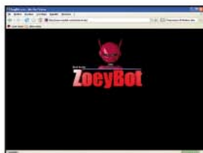
(fig.2) Pagina in cui condividere il file con un utente.

Si chiama ZoeyBot ( www.zoeybot.com/construct.aspx ), il Robot (fig. 2) che ci permette di effettuare, tra le tante sue funzioni, ricerche semplici e veloci in Internet. È sufficiente posi-