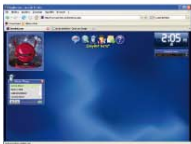
(fig.5) Pagina in cui condividere il file con un utente.