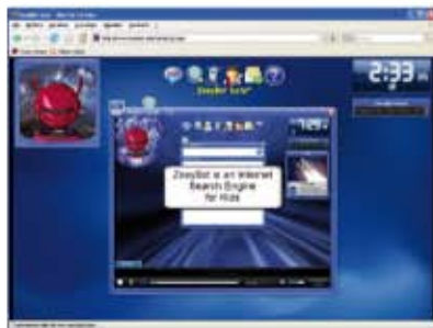
(fig.6) Pagina in cui condividere il file con un utente.

Player (fig. 5) si ascolta la musica. Ci sono pezzi per tutti i gusti, dal rock and roll alla musica classica, passando per la dance e il country. Con Zoeybot News (fig. 6) si vedono gli ultimi aggiornamenti del programma, mentre dall'area video, presente nella pagina di ricerca, è possibile guardare una presentazione di Zoeybot e leggere degli ebook (HELP) di storia, geografia e astronomia.