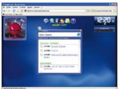
(fig.3) Pagina in cui condividere il file con un utente.